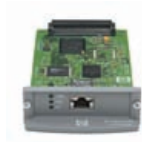
J7997G HP Jetdirect 630N IPv6 Gigabit Printserver