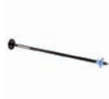
Q6709A HP Designjet 44 Zoll-Rollenzuführungsspindel