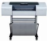
HP Designjet T1120 24-Zoll-Drucker

Dank dieses HP Designjet Druckers können Sie Kunden mit qualitativ hochwertigen Ausdrucken in brillanten Farben beeindrucken und kurzfristige Termine durch hohe Druckgeschwindigkeiten einhalten. Features für höhere Leistung liefern die gewünschten Druckergebnisse und vereinfachen die Steuerung und Verwaltung des Druckers.