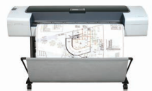
HP Designjet T1120ps 44-Zoll-Drucker

Ideal für größer werdende, anspruchsvolle Arbeitsgruppen, die auf brillante, intern gedruckte, rechtzeitig fertige Präsentationen Wert legen.