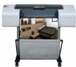
HP Designjet T1120ps 24-Zoll-Drucker