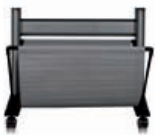
Q6663A HP Designjet Zx100/Tx100/Tx10 24-Zoll-Unterstand