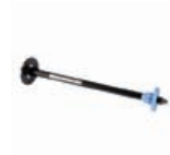
Q6700A HP Designjet Zx100/Tx100/Tx10 24-Zoll-Spindel