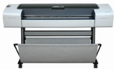
HP Designjet T1120 44-Zoll-Drucker